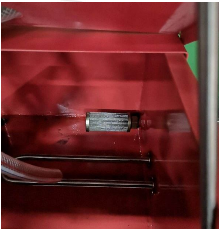
Posizione filtro all'interno del serbatoio