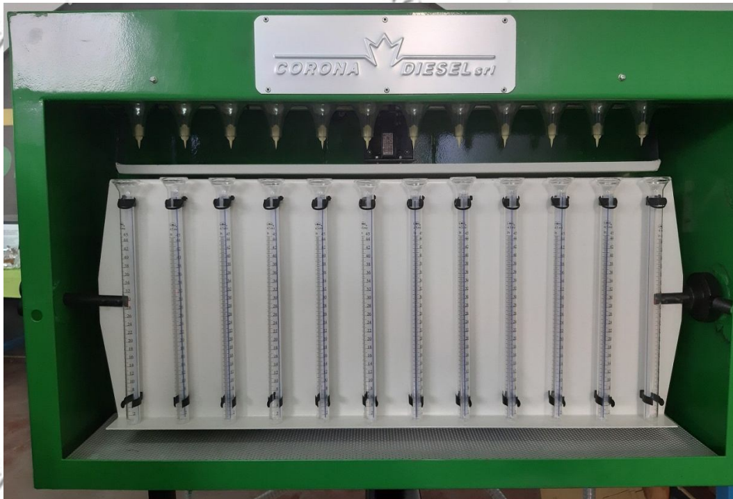
Castelletto 12 cilindri (burette da 45 ml)