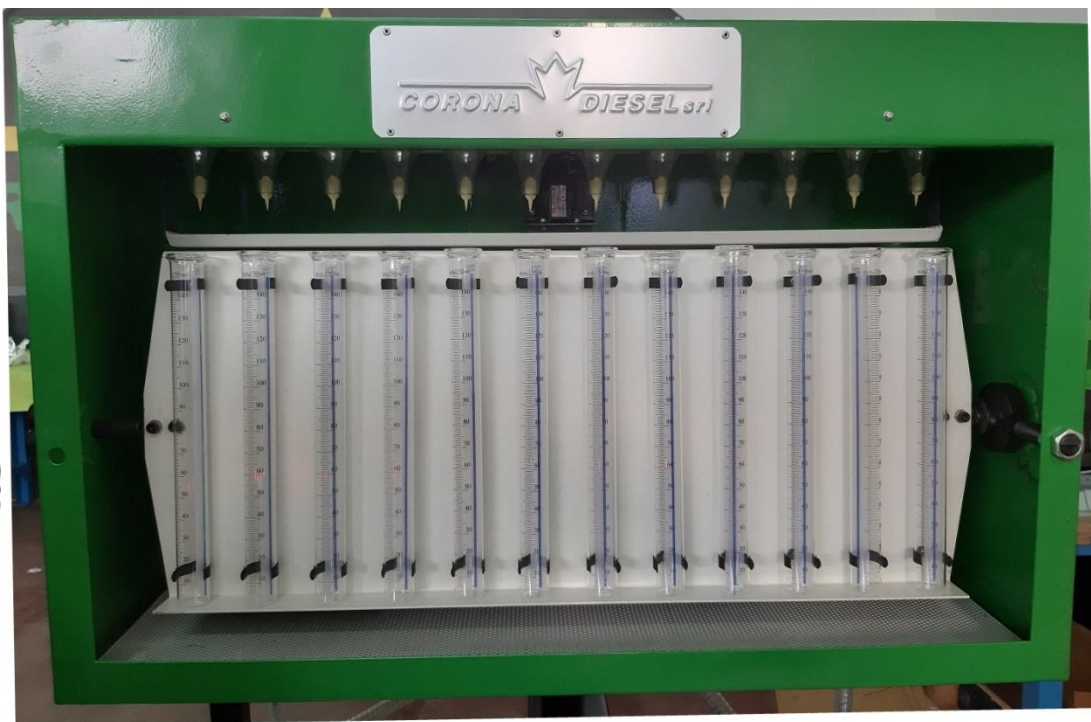
Castelletto 12 cilindri (burette da 150 ml)